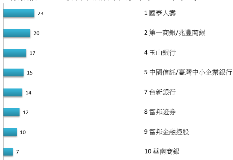
金融機構Fintech發明申請前十大(95/1/1-106/6/30)