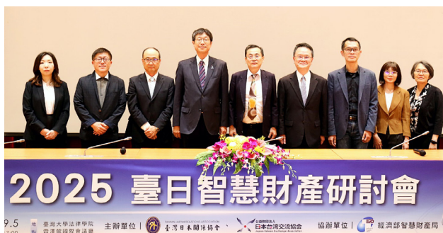
臺日智慧財產研討會

9月與臺灣日本關係協會、日本台灣交流協會共同舉辦「2025 臺日智慧財產研討會」，以臺日專利侵權訴訟之法制及實務為主軸，邀請雙方官方及民間專家分別從政府及企業界角度，分享臺日專利侵權法制與實務最新發展，及企業因應專利侵權的挑戰與策略，吸引產、官、學界逾 160 人參與。