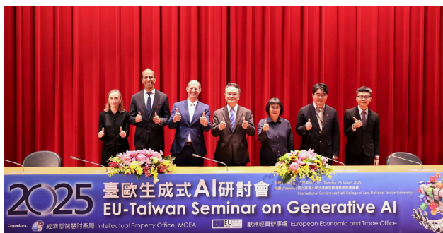
臺歐生成式 AI 研討會

3月與歐洲經貿辦事處（EETO）、歐盟在臺商業與法規合作計畫（EBRC）共同舉辦「2025 臺歐生成式 AI 研討會」，邀請雙方官方及民間專家就人工智慧與著作權之相關議題，包括歐盟人工智慧法、全球著作權法制動向觀察，以及生成式 AI 發展實務現況與挑戰等進行分享與意見交流，吸引產官學界逾 180 人參與。